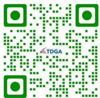
Catalog บทเรียน และคู่มือการเรียน

ติดต่อสอบถามเพิ่มเติมได้ที่ DGA CONTACT CENTER โทร 02 612 6060 e-Mail : Contact@dga.or.th Facebook : สถาบัน TDGA Website : tdga.dga.or.th